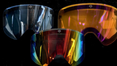
EXRTRA LENS 40002