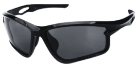
MK (MR.KOHLNBACH) BLACK EDITION MK1001