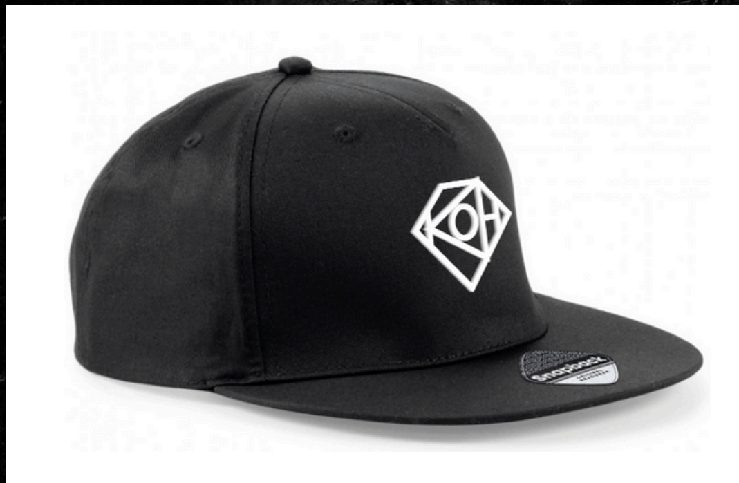
GORRA KOH NEGRO 30001

Fabricada en 100% sarga de algodón, esta pieza garantiza resistencia y transpirabilidad. Su visera plana ofrece un look moderno y versátil, ideal tanto para actividades deportivas como para el día a día.