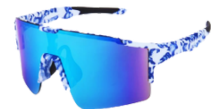
KOH SAMUI 1301