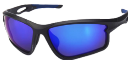
MK (MR.KOHLNBACH) SAPHIRE EDITION MK1002