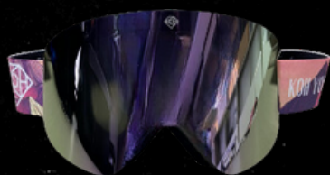
CLICK & CLACK PRO 2401