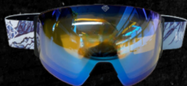
4X4 PRO 2301