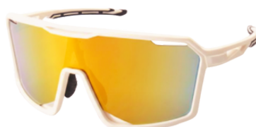
GOLDEN EYES 1402